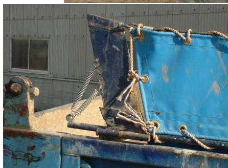
従来のコボレイン